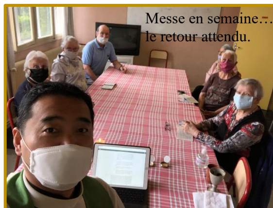
Messe en semaine... le retour attendu.

Ce dimanche, il me semble que l'Esprit-Saint soufflait dans nos églises, au-dessus des étangs, chez la copine protestante, bref partout et surtout sur chacun de nous, comme il sait si bien le faire. Alléluia ! Brigitte