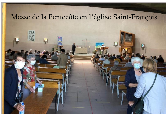
Messe de la Pentecôte en l'église Saint-François

Dans nos places confortables (une place occupée sur deux) et le silence, nous avons, affublés de nos