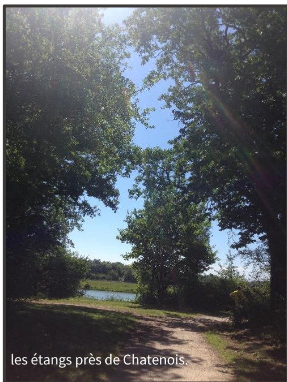
les étangs près de Chatenois.