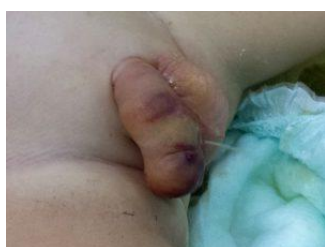
Exemple : orifice urinaire positionné en travers du pénis.