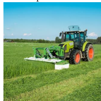
Prairie de fauche (production de foin)

Selon la nature du sol, on distingue différents types de prairies.