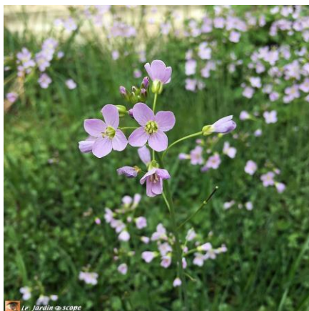
La cardamine des prés