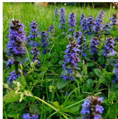
La bugle rampante