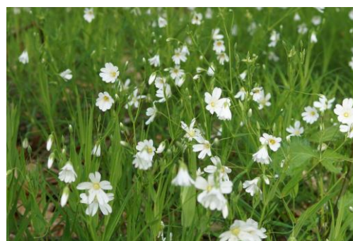
La stellaire holostée

Jolies, n'est-ce pas ? Et le savons-nous bien ?