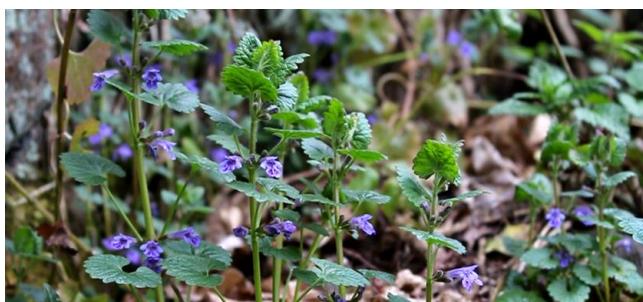
Le lierre terrestre