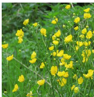
La renoncule bulbeuse