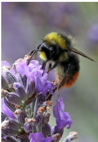
Bourdon des prés sur lavande