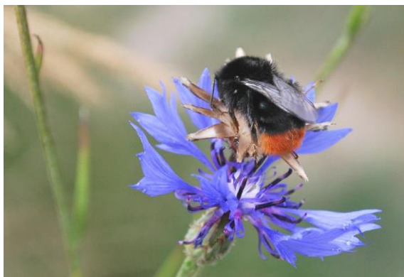
Bourdon des pierres sur bleuet