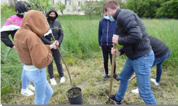
Faisait pas très beau, la terre était dure, mais ils étaient résolus, les jeunes de la profession de foi de la paroisse Saint Michel !