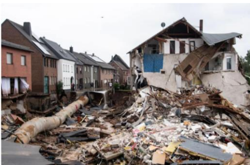
Inondations en Allemagne

la désolation et la mort, se produisant lors d'aléas climatiques particulièrement violents .