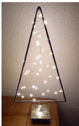
Sapin métal, fer noir rond diamètre 6 mm guirlande LED (piles AA non fournies)