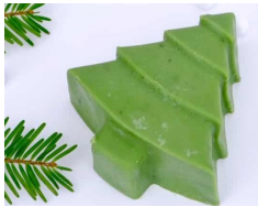
Savon Sapin de Noël - 110g

Hello my bio est notre entreprise familiale, engagée pour le bien-être et le respect de tous les êtres vivants. Nous imaginons, formulons et créons des cosmétiques naturels et bio, qui se veulent éco'éthiques. Sans ingrédients inutiles ni controversés. Uniquement avec ce que la nature nous offre de meilleur.