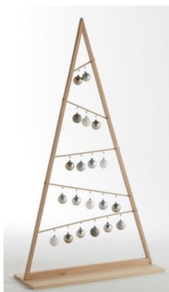
Sapin bois, vernis incolore guirlande LED (piles AA non fournies) ou guirlande petites boules suspendues