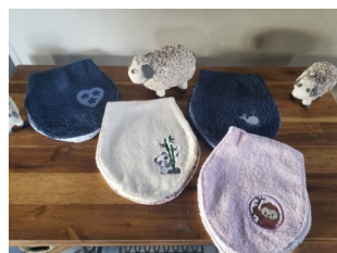
Protège épaule pour petites « bavouilles » de bébé Différents coloris