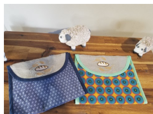
Sac à baguettes avec son anse 43 cm*26 cm Différents coloris