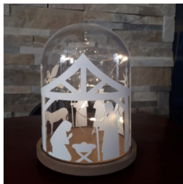
Globe lumineux crèche - 20 cm