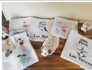
Torchon de cuisine 45 cm* 54 cm Différents coloris