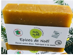
Savon Epices de Noël - 110g