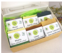
Coffret 6 mini savons 70g chacun