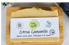
Savon Citron Camomille