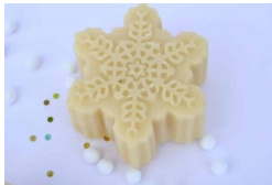
Savon Flocon de Neige - 110g