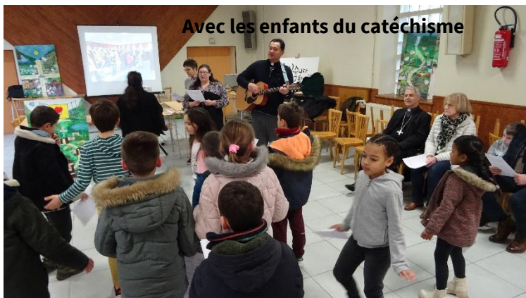
Avec les enfants du catéchisme