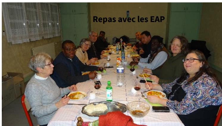
Repas avec les EAP