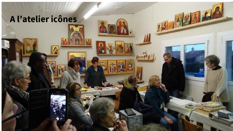
A l'atelier icônes