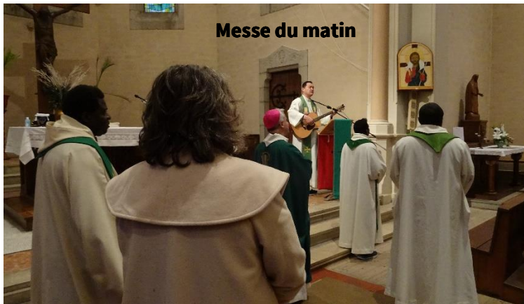
Messe du matin

Voici le résumé en photos (merci Philippe)