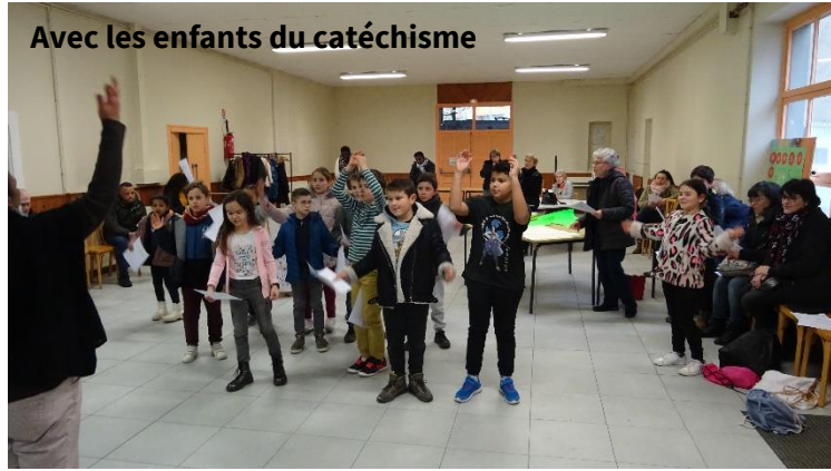
Avec les enfants du catéchisme