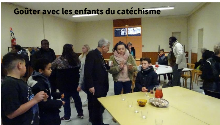
Goûter avec les enfants du catéchisme