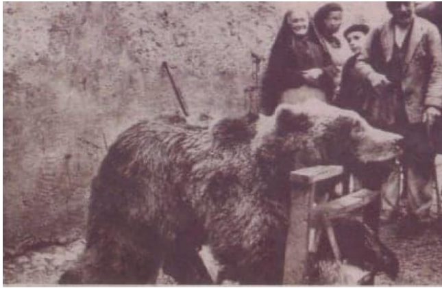
Haut-Jura : comment les derniers ours ont été abattus - La Tribune Republicaine

En Europe de l'ouest, son domaine vital s'est très réduit . En cause : déforestation, infrastructures meurtrières (routes, chemins de fer), stations touristiques en montagne, chasse et braconnage (l'ours est mal accepté par les éleveurs).