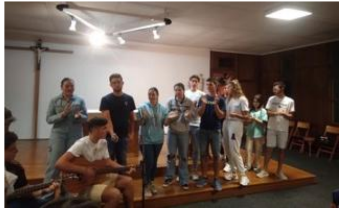
Inclure les jeunes