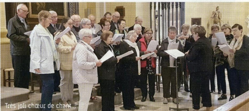
Très joli chœur de chant...