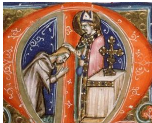
Imposition des Cendres – Missel romain – Manuscrit napolitain vers 1370