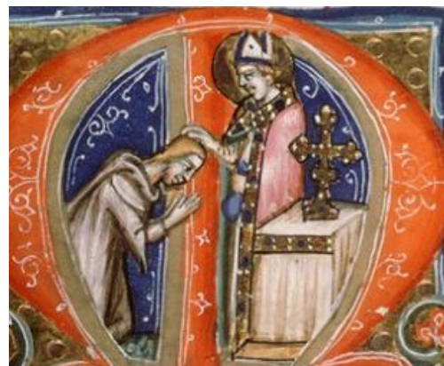
Imposition des Cendres – Missel romain – Manuscrit napolitain vers 1370