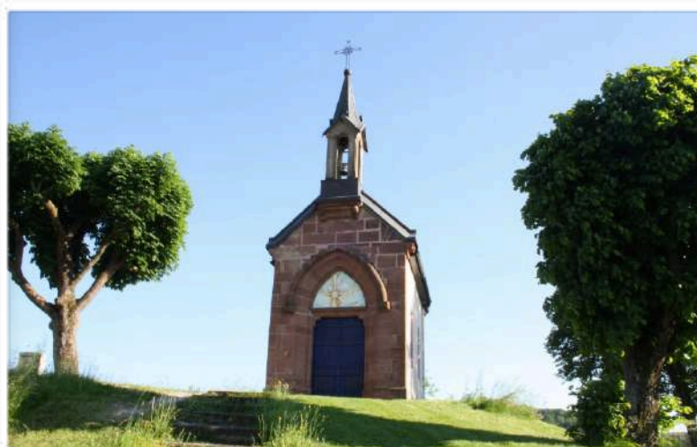
Chapelle Notre-Dame de Bon-Secours (Mandeure).