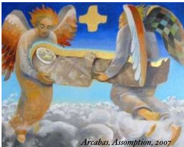
Arcabas, Assomption, 2007