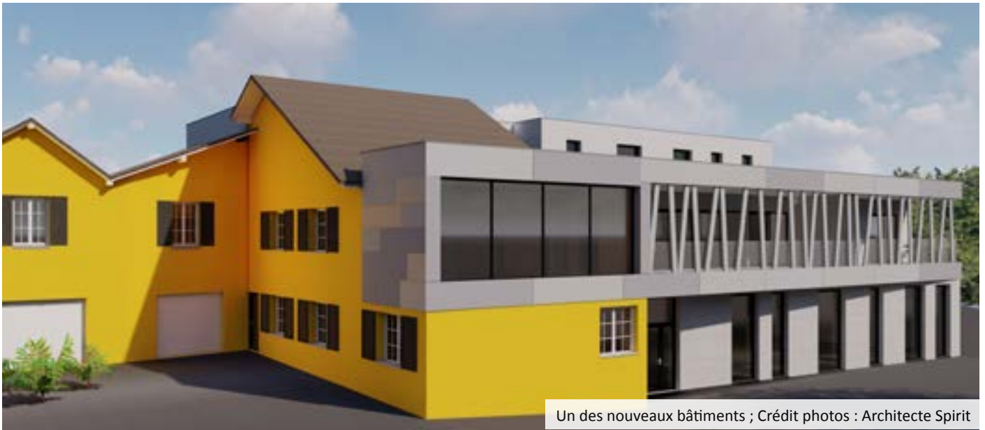
Un des nouveaux bâtiments ; Crédit photos : Architecte Spirit