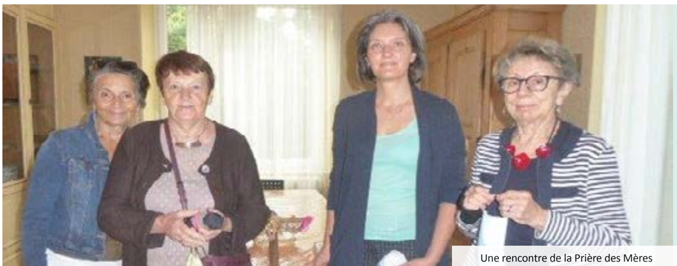
Une rencontre de la Prière des Mères

La Prière des Mères s'adresse à des femmes qui désirent prier ensemble pour leurs enfants mais aussi pour tous les enfants du monde. Ce mouvement, fondé en Angleterre en 1995, rassemble aujourd'hui des femmes qui prient dans le monde chaque semaine, dans plus de 100 pays.