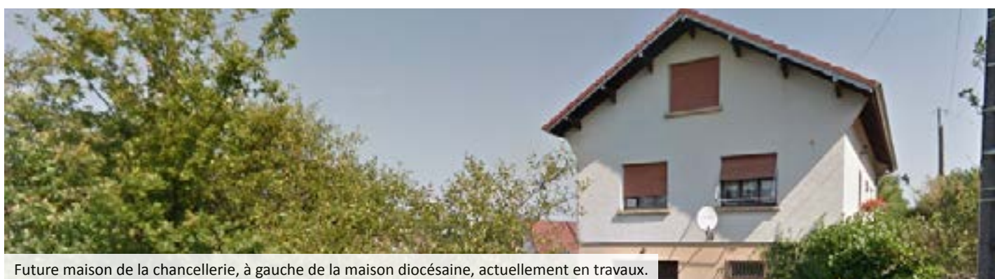
Future maison de la chancellerie, à gauche de la maison diocésaine, actuellement en travaux.