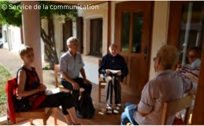
Journée des amis de Chauveroches, 20 septembre 2020.

Le Prieuré Saint Benoît, c'est une belle vigne donnée par le Seigneur, dès la fondation du diocèse. Le Seigneur continue d'appeler des ouvriers, leur demandant de prendre soin de cette belle plantation et de la faire fructifier. Voici comment nous pourrions définir la visée du Centre spirituel à venir.