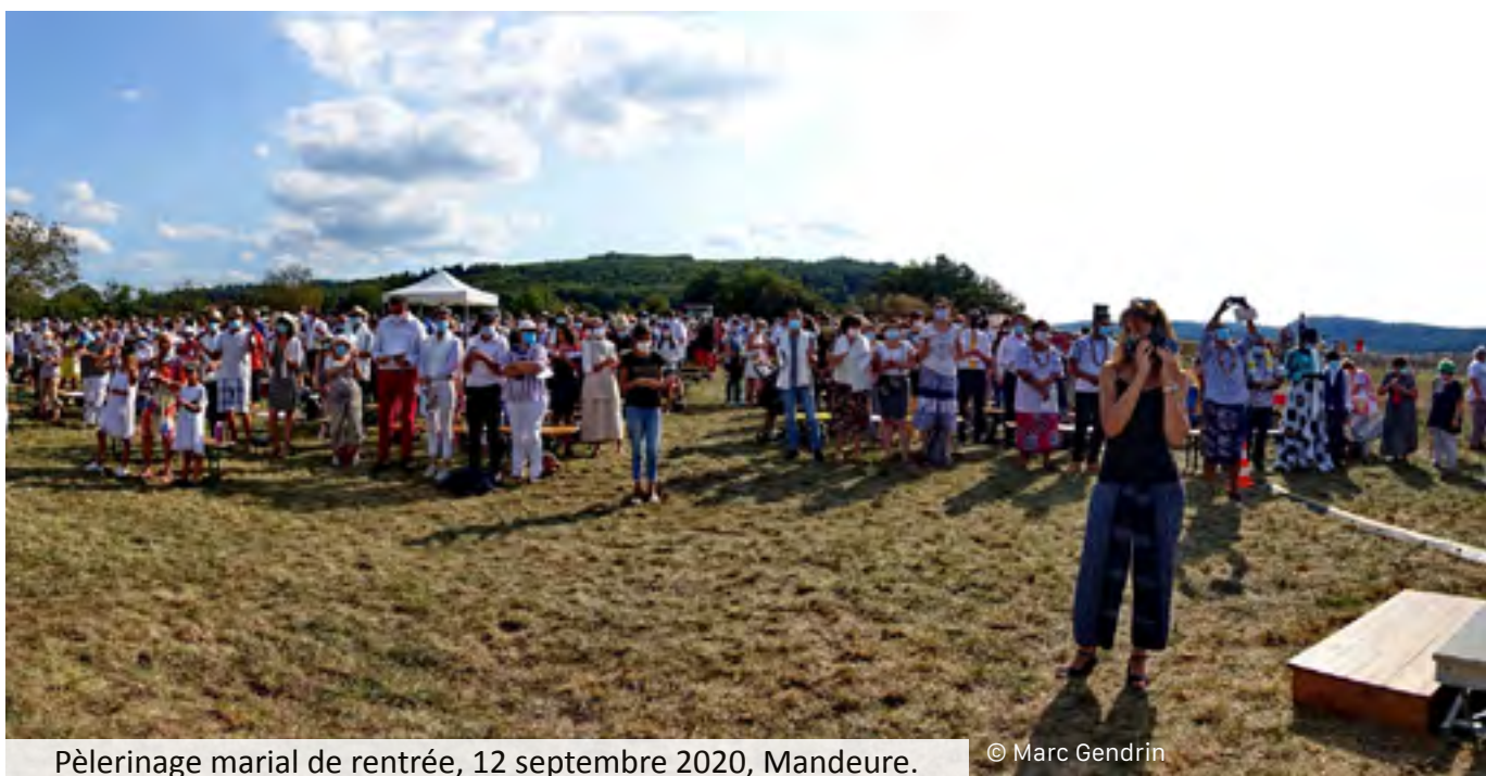
Pèlerinage marial de rentrée, 12 septembre 2020, Mandeure.