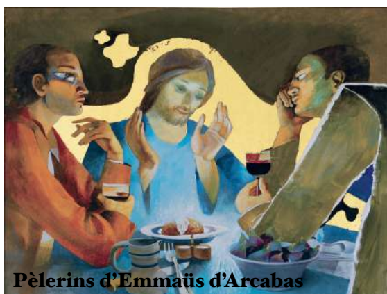
Pèlerins d'Emmaüs d'Arcabas