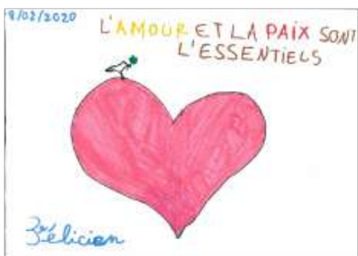
Un dessin du doyenné de Beaucourt-Delle