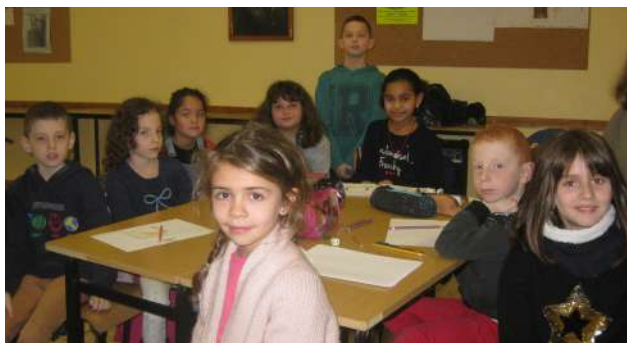
Un groupe d'enfants de la paroisse Saint Barnabé à Héricourt.