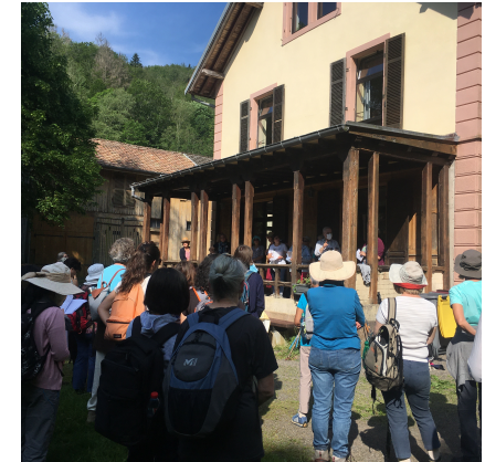
Pèlerinage des femmes