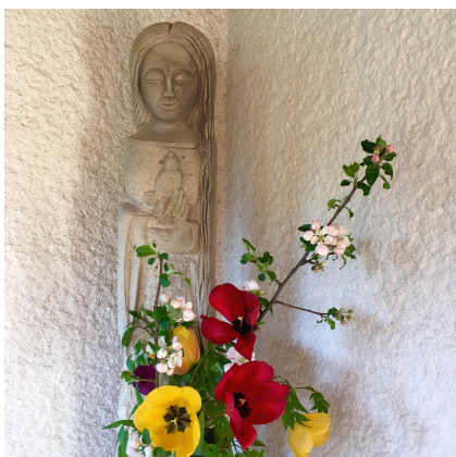
Vierge dans le cloître