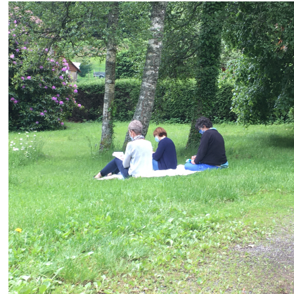
recollecion des laïcs en mission ecclésiiale