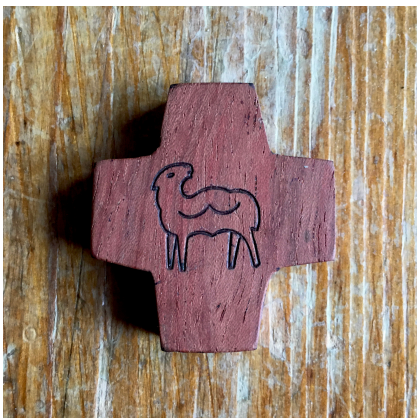
croix produite à Chauveroch