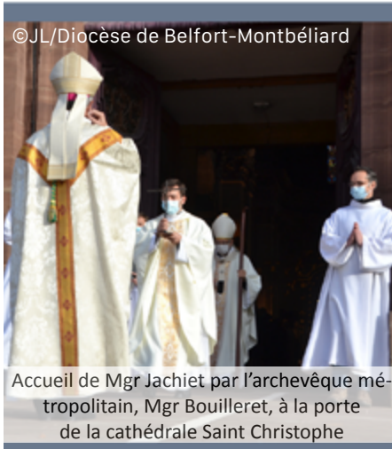
Accueil de Mgr Jachiet par l'archevêque métropolitain, Mgr Bouilleret, à la porte de la cathédrale Saint Christophe

Ceux que le Seigneur place en premier dans l'annonce de la Bonne Nouvelle, Isaïe le proclame, ce sont les humbles, les cœurs brisés. Ils sont l'objet de la première Béatitude car ce sont les plus pauvres qui ont un accès direct à son Royaume. Qu'ils soient atteints dans leur corps ou blessés dans leur âme ; prisonniers derrière des barreaux ou captifs d'esclavages ; endeuillés par la perte d'un proche ou par l'exil de leur patrie, tous ils ont un cœur de pauvre et une place de choix dans l'amour du Christ et dans son Église qui les honore aujourd'hui. »