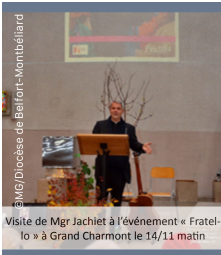
Visite de Mgr Jachiet à l'événement « Fratello » à Grand Charmont le 14/11 matin