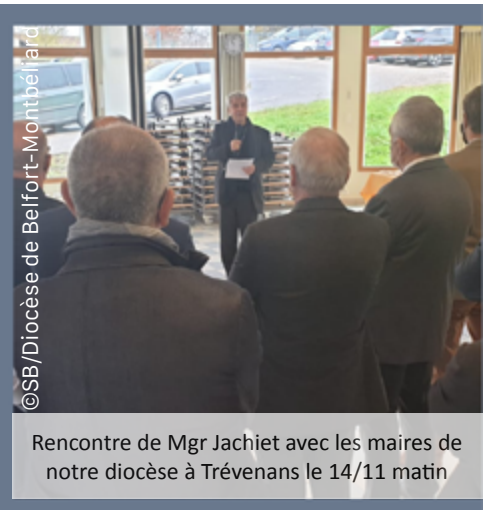
Rencontre de Mgr Jachiet avec les maires de notre diocèse à Trévenans le 14/11 matin