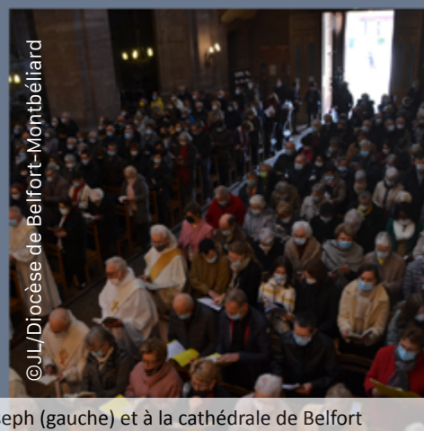
L'assemblée diocésaine à l'église Saint-Joseph (gauche) et à la cathédrale de Belfort