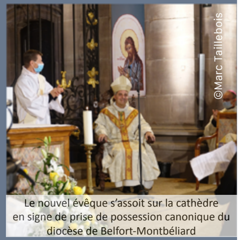
Le nouvel évêque s'assoit sur la cathèdre en signe de prise de possession canonique du diocèse de Belfort-Montbéliard