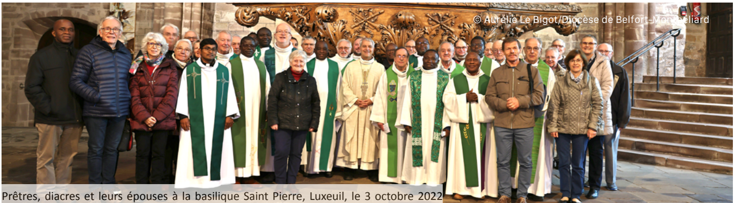
Prêtres, diacres et leurs épouses à la basilique Saint Pierre, Luxeuil, le 3 octobre 2022