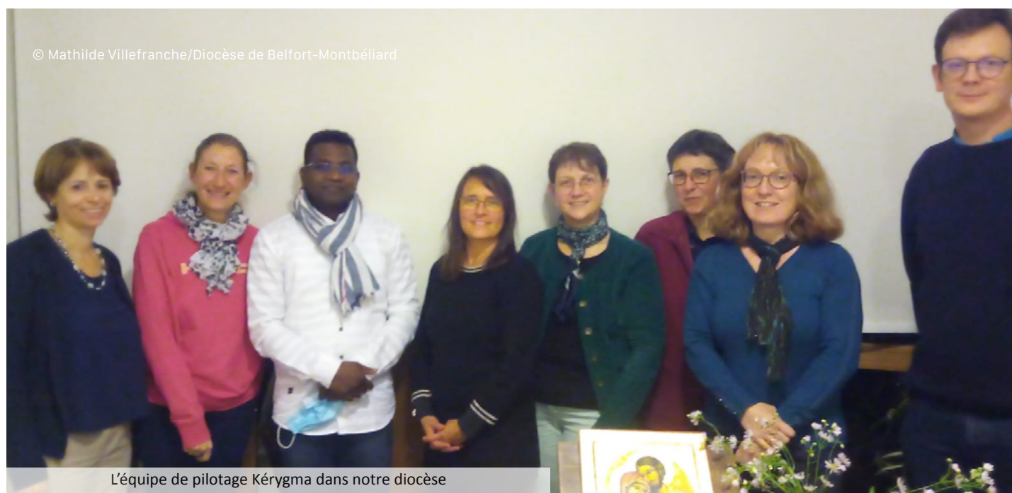
L'équipe de pilotage Kérygma dans notre diocèse

L'Église de France, sous l'impulsion du Conseil pour la Catéchèse et le Catéchuménat, initie la « démarche Kérygma ». Depuis septembre dernier, les diocèses sont invités à rentrer dans ce projet dont la visée principale est de redynamiser l'activité catéchétique (au sens large), et de préciser sa place dans le cadre de la réflexion autour de la nouvelle évangélisation.