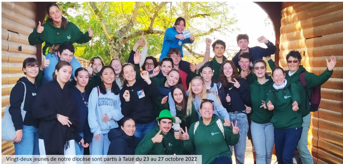
Vingt-deux jeunes de notre diocèse sont partis à Taizé du 23 au 27 octobre 2022