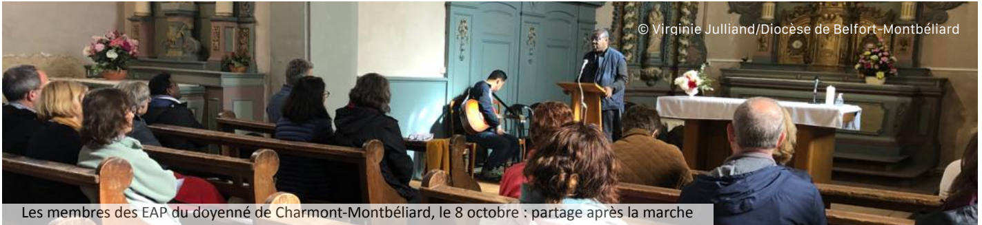
Les membres des EAP du doyenné de Charmont-Montbéliard, le 8 octobre : partage après la marche

Le discernement et la reconnaissance mutuelle des charismes sont essentiels pour la vie des communautés chrétiennes et leur mission. Relisons 1 Co 12 : les dons de l'Esprit pour bâtir le Corps du Christ.