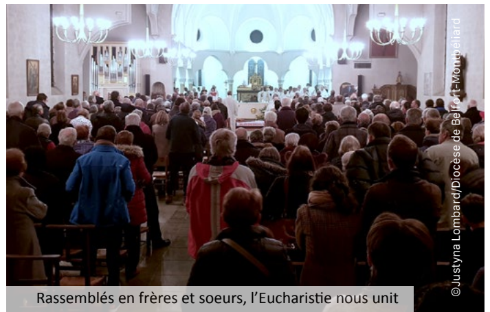
Rassemblés en frères et soeurs, l'Eucharistie nous unit