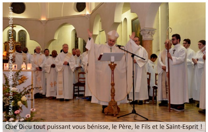
Que Dieu tout puissant vous bénisse, le Père, le Fils et le Saint-Esprit !