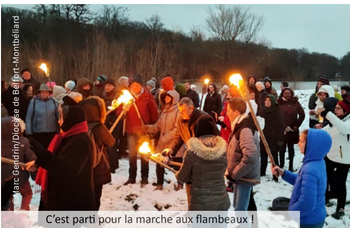
C'est parti pour la marche aux flambeaux !