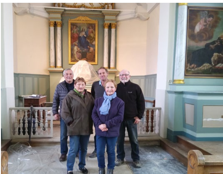
Les bénévoles ont généreusement contribué à la sauvegarde de l'église