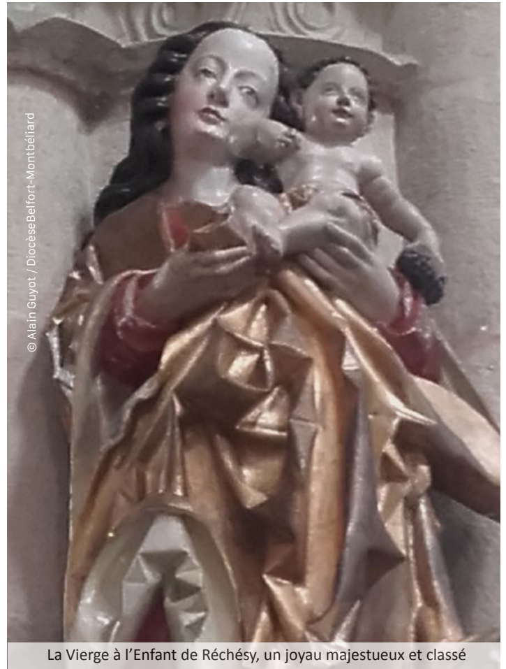
La Vierge à l'Enfant de Réchésy, un joyau majestueux et classé

Il y a tout juste 25 ans (du 13 février au 11 mai 1998), du haut de ses 150 à 170 cm, en bois de tilleul, à l'expression douce et rêveuse et dont les origines remontent au XVe siècle, la Vierge à l'Enfant de Réchésy, classée monument historique devenait le centre d'intérêt pour les passionnés d'Art.