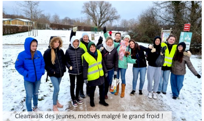
Cleanwalk des jeunes, motivés malgré le grand froid !