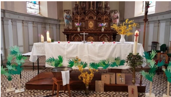
Les Rameaux-mains des enfants du caté, paroisse St Jean l'Évangéliste, 2022

ACCLAMONS LE SEIGNEUR ! IL NOUS DONNE SA VIE. QUE GERME LE BONHEUR AU JARDIN DE NOS CŒURS !