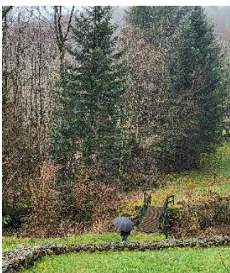
Une vingtaine de catéchistes rassemblés à Chauveroches pour un temps de halte bienvenu autour de la Parole de Dieu