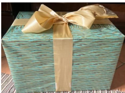
(base du jalon collectif « Dieu se donne » paroisse Notre Dame de la Paix-Montenois)