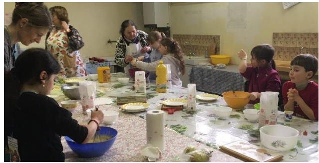
Paroisse St Pierre : après-midi réflexion/action avec le CCFD.