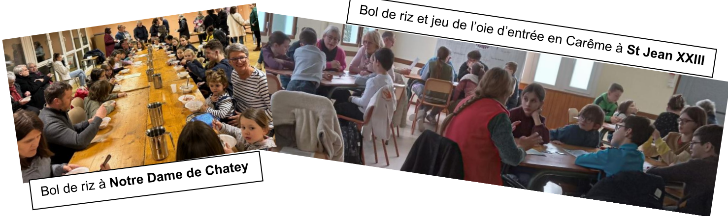
Bol de riz et jeu de l'oie d'entrée en Carême à St Jean XXIII