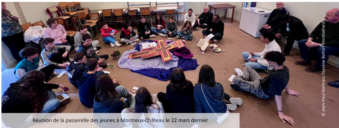
Réunion de la passerelle des jeunes à Montreux-Château le 22 mars dernier

Après la profession de foi, que deviennent nos jeunes avant de s'inscrire à la confirmation ? La volonté de les accompagner dans leur vie chrétienne a fait naître une nouvelle initiative pastorale portée par les prêtres, animatrices des jeunes et catéchistes des doyennés de Beaucourt-Delle et de Chèvremont.