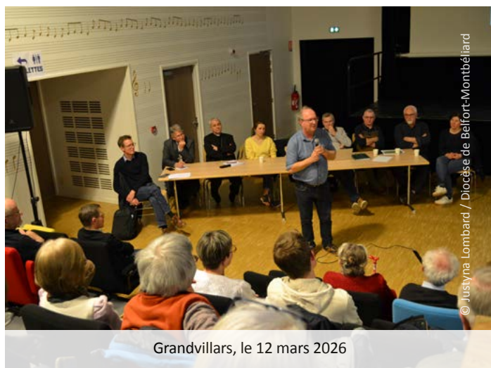
Grandvillars, le 12 mars 2026

La soirée « Parlons-en! » consacrée à l'agriculture, le 12 mars à Grandvillars, a offert un espace de dialogue entre professionnels, consommateurs et acteurs de l'Église. La rencontre a croisé regards de terrain, données factuelles et éclairage spirituel.