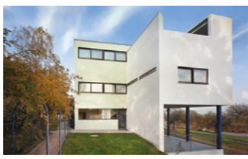
Allemagne, Argentine, Belgique, France, Inde, Japon, Suisse.

Immeuble Clarté / Maison de la Culture de Firminy / Couvent Sainte-Marie-de-la-Tourette / Petite villa au bord du lac Léman / Unité d'habitation à Marseille / Musée National des Beaux-Arts de l'Occident / Manufacture à Saint-Dié / Cité Frugès / Cabanon de Le Corbusier / Villa Savoye et loge du jardinier / Maison Guitte Complexe du Capitole / Maisons La Roche et Jeanneret / Maison du Docteur Curatier / Immeuble locatif à la Porte Molitor / Chapelle Notre-Dame-du-Haut / Maisons de la Wiedenhof-Siedlung // www.lecorbusier-worldheritage.org La Fondation Le Corbusier assure le secrétariat de la Conférence permanente internationale des sept États membres.